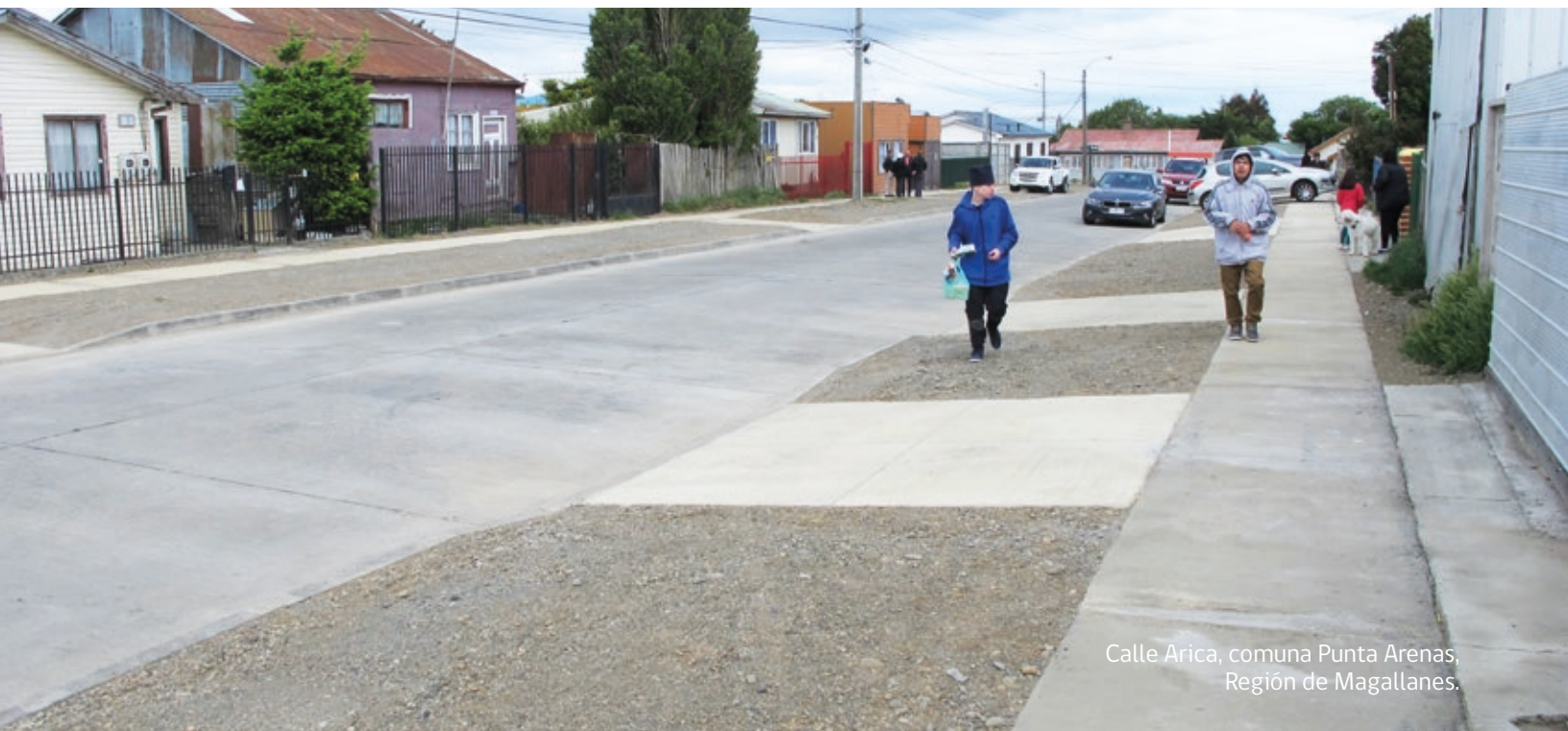
Calle Arica, comuna Punta Arenas, Región de Magallanes.