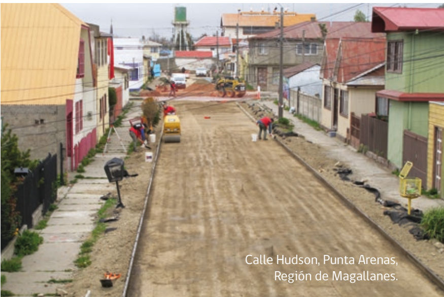
Calle Hudson, Punta Arenas, Región de Magallanes.