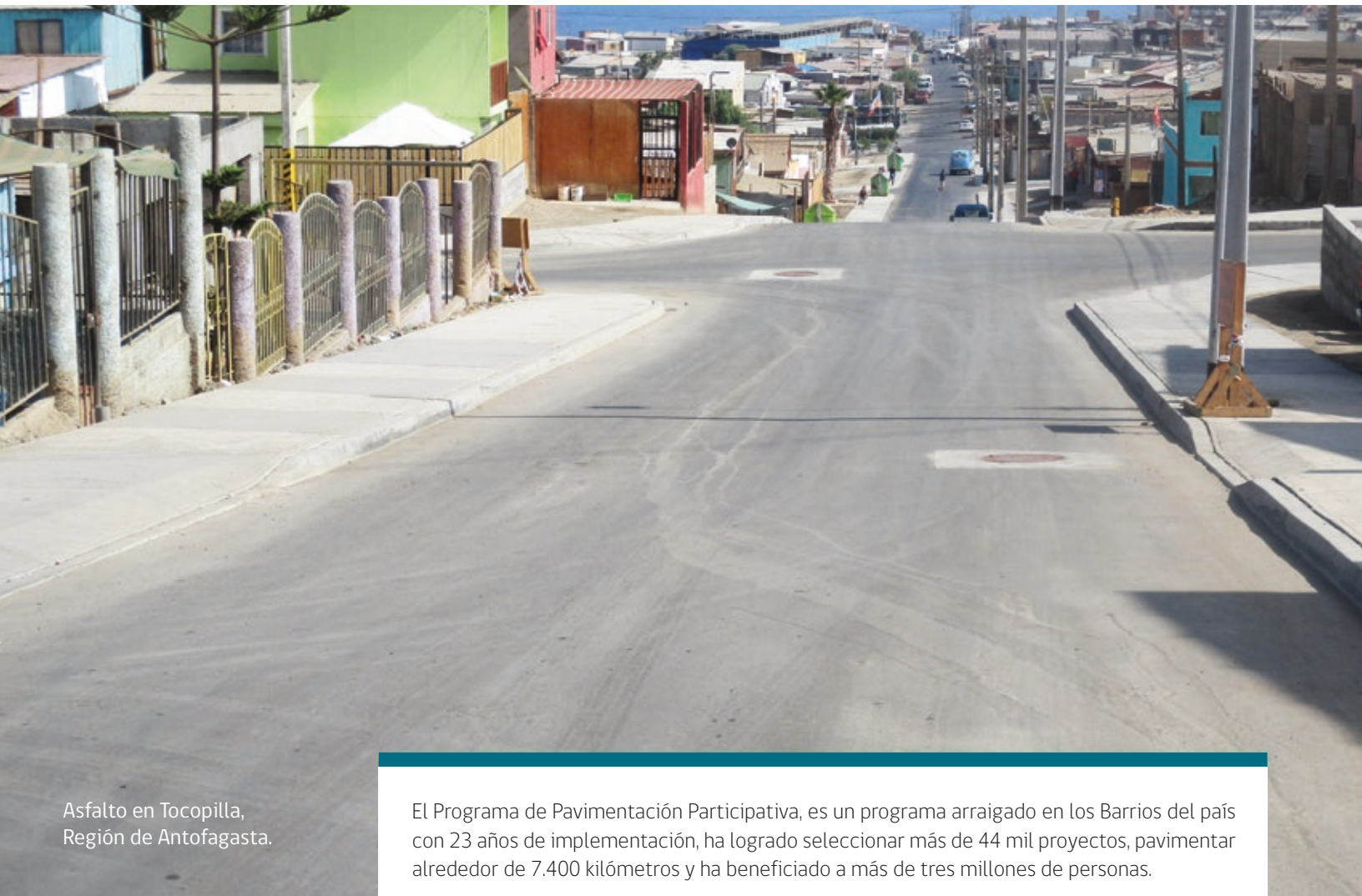
Asfalto en Tocopilla, Región de Antofagasta.