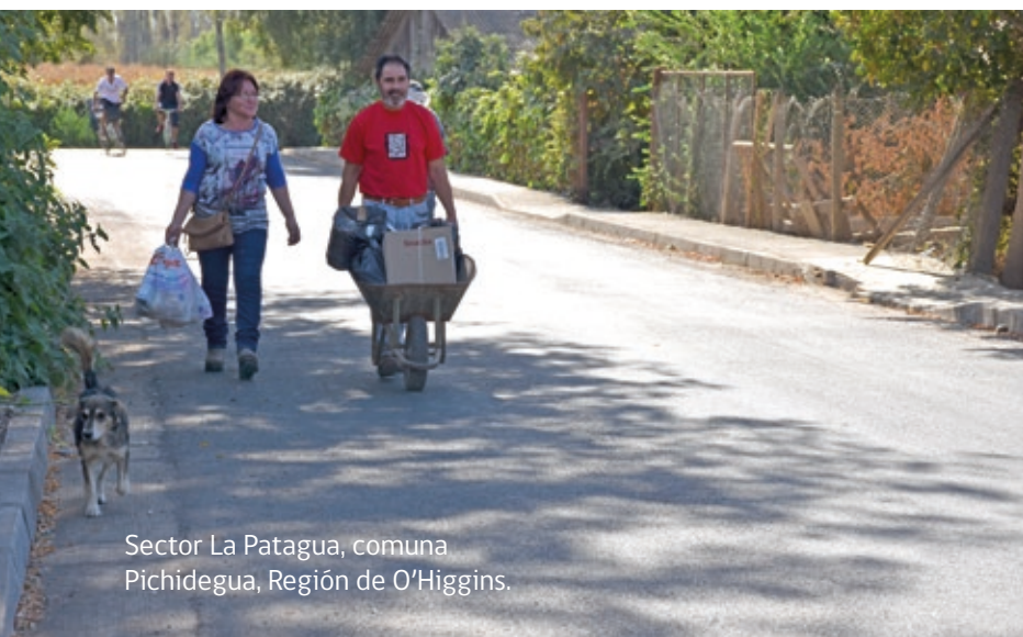
Sector La Patagua, comuna Pichidegua, Región de O'Higgins.