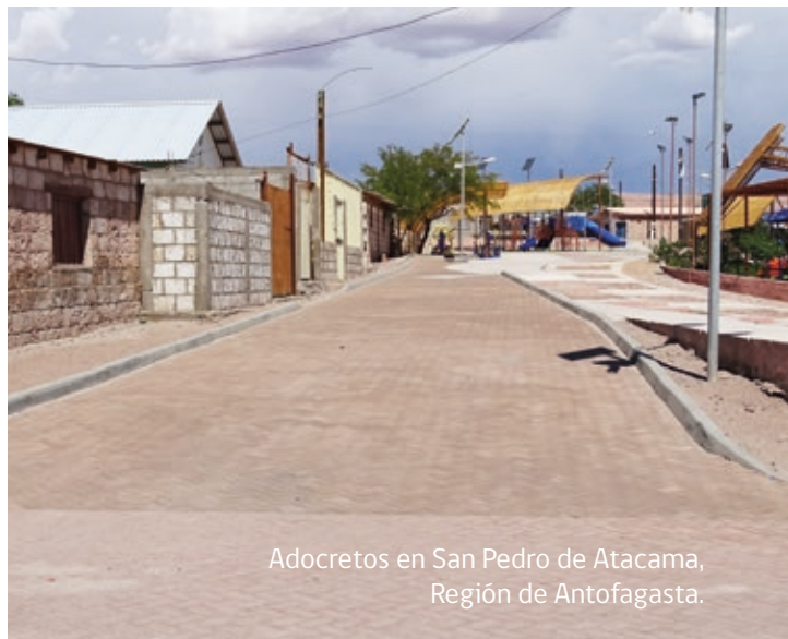
Adocretos en San Pedro de Atacama, Región de Antofagasta.