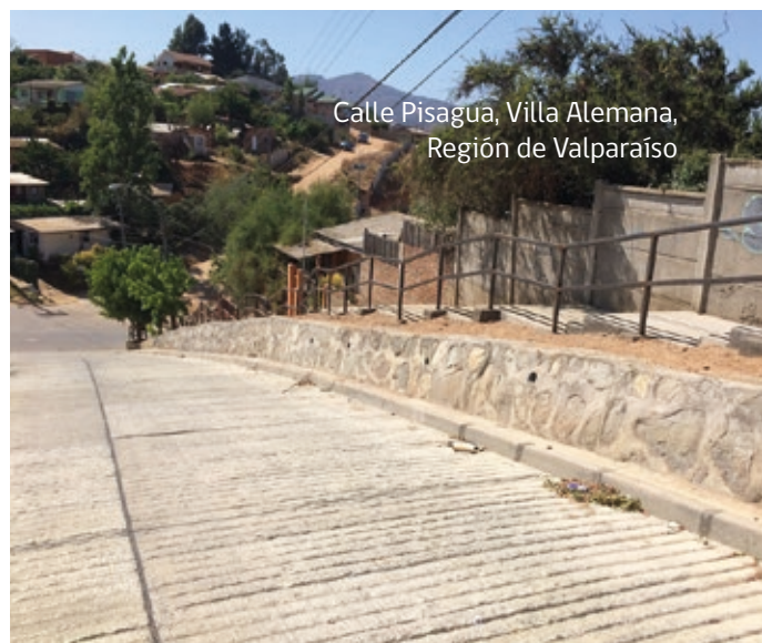
Calle Pisagua, Villa Alemana, Región de Valparaíso