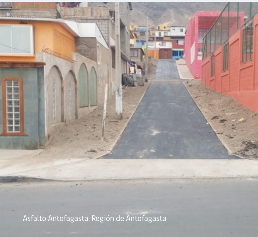
Asfalto Antofagasta, Región de Antofagasta

Al finalizar las obras, la comunidad participa del acto de recepción y puede disfrutar del resultado de su esfuerzo. En la segunda reunión en terreno y respondiendo la Encuesta de Satisfacción, el Comité de Pavimentación puede manifestar su grado de conformidad de su participación en los procesos del Programa y con la calidad de las obras de pavimentación que reciben.